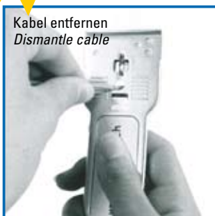
Kabel entfernen Dismantle cable