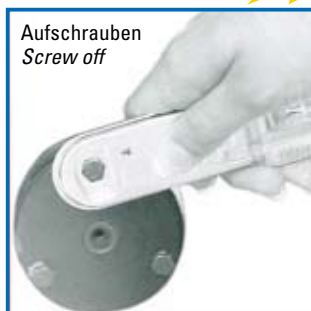
Aufschrauben Screw off