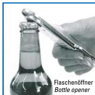
Flaschenöffner Bottle opener